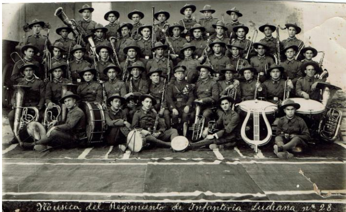
Música del regimen Luchana 28 a Melilla l'any 1922.

Sense agrupació musical local, les Festes Majors de 1910 són amenitzades per una banda de fora, en aquesta ocasió la del Regiment d'infanteria de Luchana 21 , aquarterat a Tortosa.