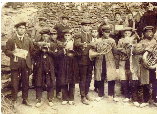
Primers músics de La Lira