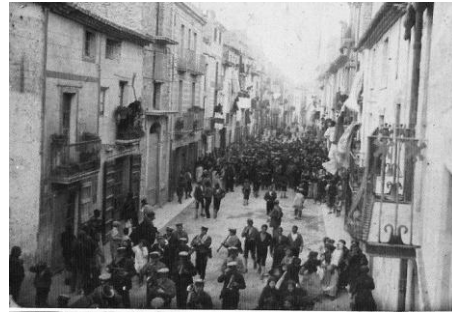
Una banda forastera pel carrer Major, principis de segle XX.