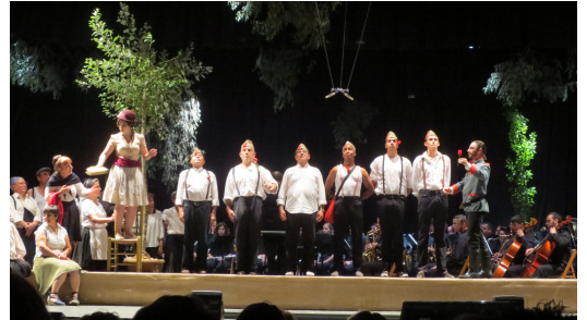
L'Elixir d'amor (2017)